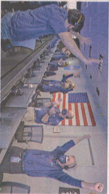
Celebración. El personal de la NASA celebró la llegada.

La misión del rover —del tamaño de un coche y una tonelada de peso— está centrada científicamente en descubrir si alguna vez hubo vida en Marte en el pasado. Su destino es una cuenca donde los científicos creen que un antiguo río desembocaba en un lago y depositaba sedimentos en forma de abanico conocido como delta. EUROPA PRESS